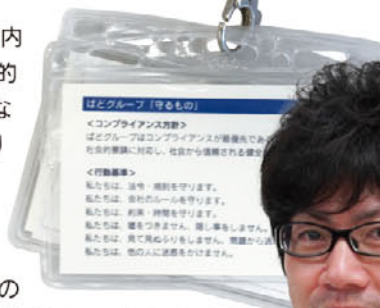
▲名札の裏に記載されているコンプライアンス方針

あげられます。効率的に業務遂行できる環境を整えながら、不正を防ぐ仕組み作りを今後も継続してやっていきます。