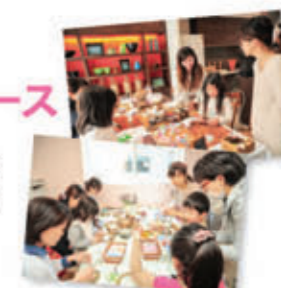
例)企業様主催のイベントへのコンテンツ提供、ママ作家によるワークショップ