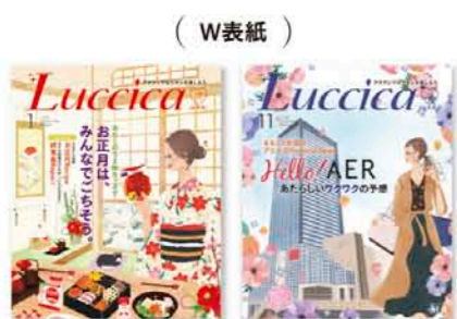
( W表紙 )