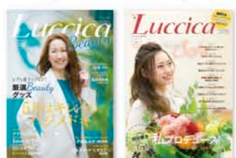
( BOOK in BOOK )