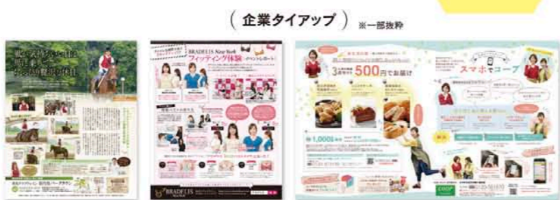
( 企業タイアップ ) 一部抜粋